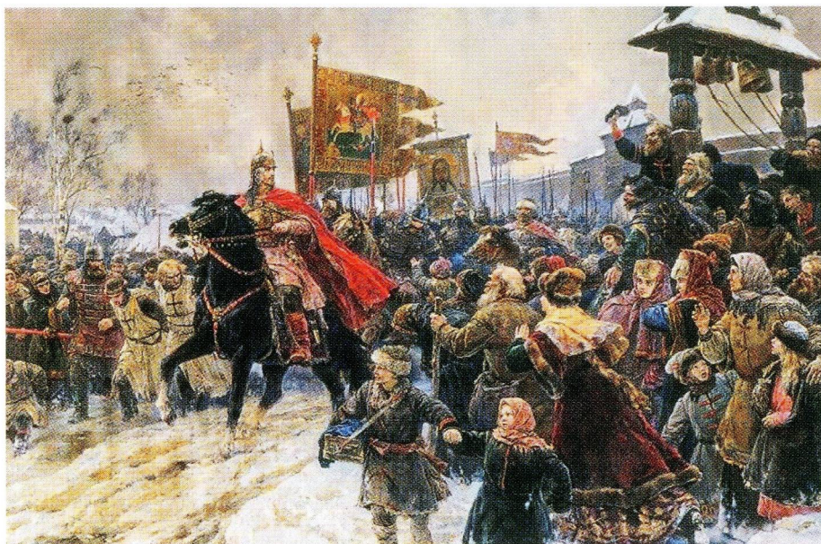
Въезд Александра Невского в Псков после Ледового побоища. Художник В. А. Серов

предание, что в Невской битве Александру помогали святые князья Борис и Глеб. Тем не менее строптивые новгородцы в том же году ухитрились поссориться с князем Александром и вынудили его покинуть их землю. Он уехал в Переяславль-Залесский.