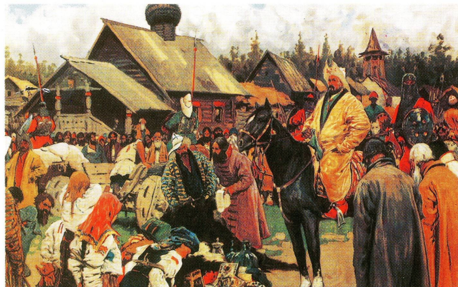
Баскаки. Художник С. В. Иванов

Со смертью Берке набеги ордынцев на Русь пошли на убыль, и уже одно это стало заметным облегчением для народа. Люди если не привыкали, то, по крайней мере, принараивались жить «под татарами». Они начали от-