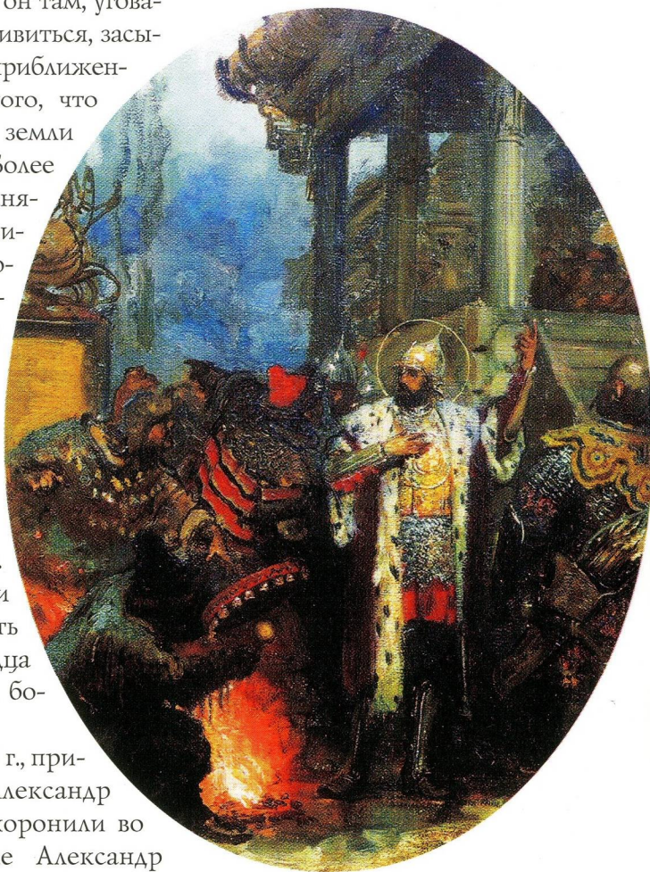
Александр Невский в Орде. Художник Г. И. Семирадский

В начале XVIII в. по повелению Петра Великого мощи князя перенесли в Санкт-Петербург, в Александро-Невскую лавру.