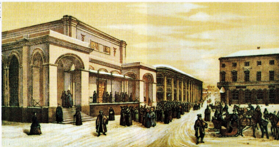
Здание Московской биржи. Литография. Сер. 19 в.

также вигоневая пряжа, шёлк и шёлковая пряжа, шерсть и козий пух, шерстяная пряжа, льняная пряжа и нитки, цветные металлы, чугун, железо, нефть и нефтепродукты, каменный уголь, антрацит и кокс, сахар и сахарный песок, продукция химич. пром-сти. Среди ценных бумаг преобладали облигационные займы, в т. ч. государственные (в 1913 – 60,5% общей суммы облигаций). В офиц. котировку к нач. 1913 были допущены акции 69 акционерных обществ на сумму 784,24 млн. руб. по номиналу (в т. ч. акции 29 коммерч. и земельных банков на 480,52 млн. руб.), а также 146 разл. твёрдопроцентных бумаг. Совершались обороты с векселями и чеками за границу, а также с большинством бумаг, введенных в котировку С.-Петербур. биржи.