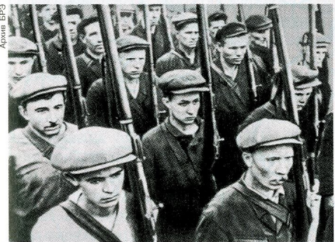
Ополченцы. Фото 1941.

наступление герм. 9-й армии, заняв охватывающее положение по отношению к левому крылу группы армий «Центр». К началу нояб. 1941 на зап. направлении сохранилась крайне тяжёлая обстановка. Сплошной линии обороны не было, резервов, способных в короткий срок закрыть бреши, командования фронтов не имели. В этой обстановке Ставка ВГК приняла решение о создании нового стратегич. фронта обороны. Гл. рубежом сопротивления на подступах к Москве была определена Можайская линия обороны, на которую выдвигались резервы Ставки и войска с др. направлений.