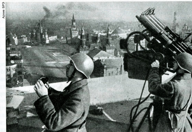
На страже московского неба. Фото. Осень 1941.