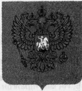
Россия Федерациясе гербы.